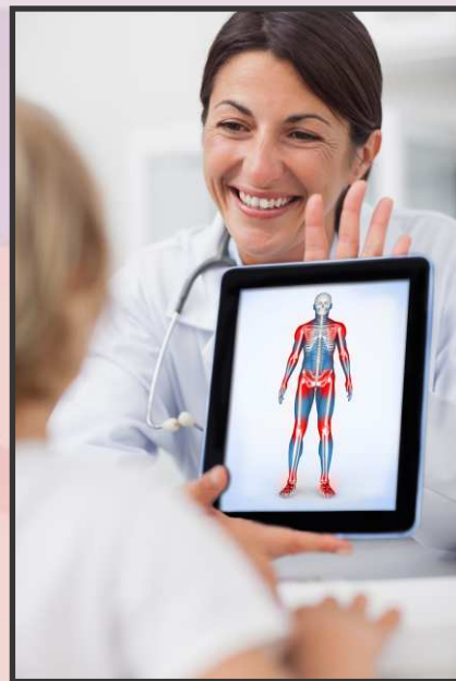
PatientLogix MD gives your patients meaningful Health Education support for better outcomes.

Le système, bien que rentable, fournit des caractéristiques typiques de solutions plus complexes et plus coûteuses. À aucun moment, la confidentialité des patients à risque d'être compromise puisque les renseignements personnels des patients ne sont jamais enregistrés dans le système PatientLogix MD et les données anonymes qui sont enregistrées dans PatientLogix MD résident sur la plateforme Microsoft Azure rencontrant la conformité des normes et procédures HIPAA.