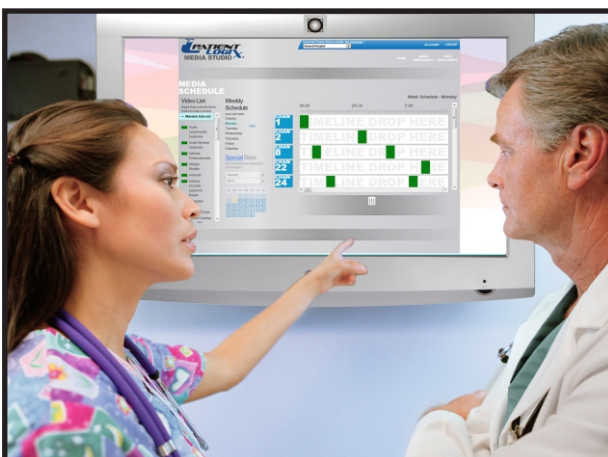
Gestion des médias et rapports