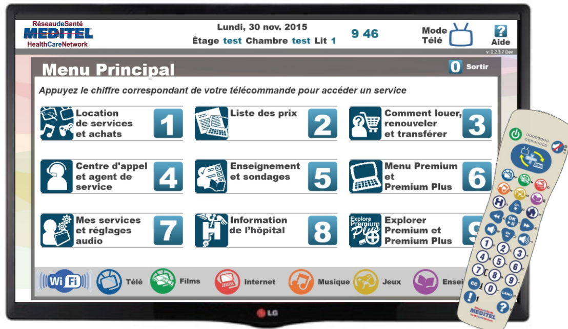
Terminal à grand écran de médias et télécommande à distance avec haut-parleur et clavier QWERTY intégré

DIVERTISSEMENT INFORMATIF, COMMUNICATION, PROGRAMMES ÉDUCATIF À LA SANTÉ, SONDAGES, AGENTS AU CHEVET ET CENTRE D'APPEL