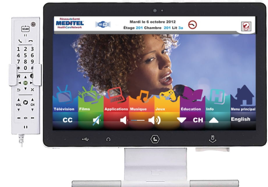
Terminal tactile de chevet avec téléphone VoIP et télécommande intégré

Le menu simple et intuitif présente des icônes facilement identifiables, des invites et du texte descriptif à l'écran, des touches surdimensionnées pour effectuer le processus sur un écran tactile ou un contrôle avec haut-parleur intégré qui permet au personnel médical de naviguer rapidement et efficacement entre les applications.